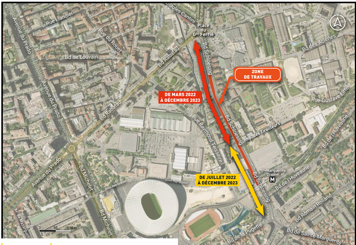
Plan de situation

Le projet d'extension du réseau de tramway vers le sud entre dans sa phase opérationnelle. Ainsi les travaux de voirie et d'aménagements urbains, de la section du boulevard Schloesing située entre la place du Général Ferrié et le carrefour de Sainte-Marguerite - Dromel, débuteront à compter du 21 mars 2022.