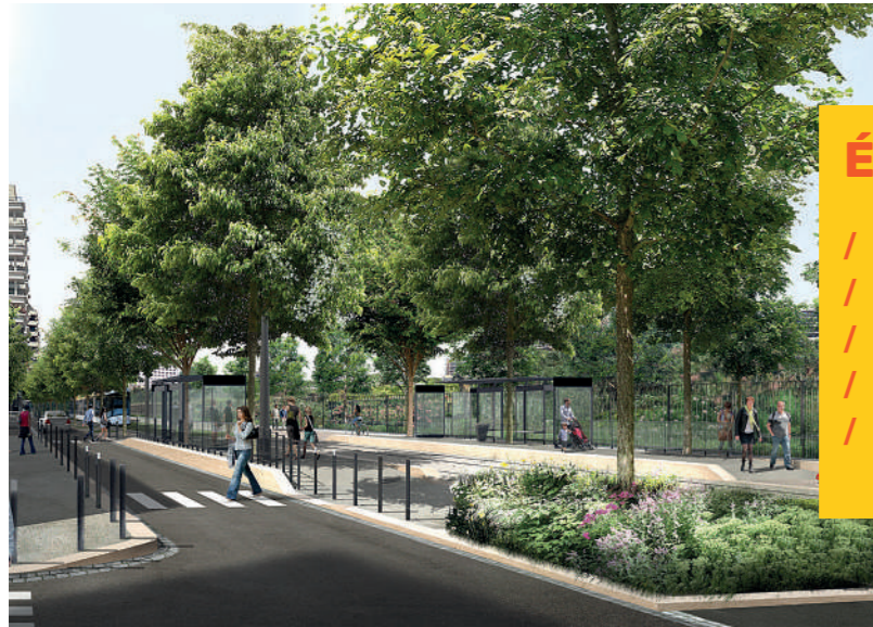
Photomontage - Avenue Jules Cantini - Parc du 26e centenaire