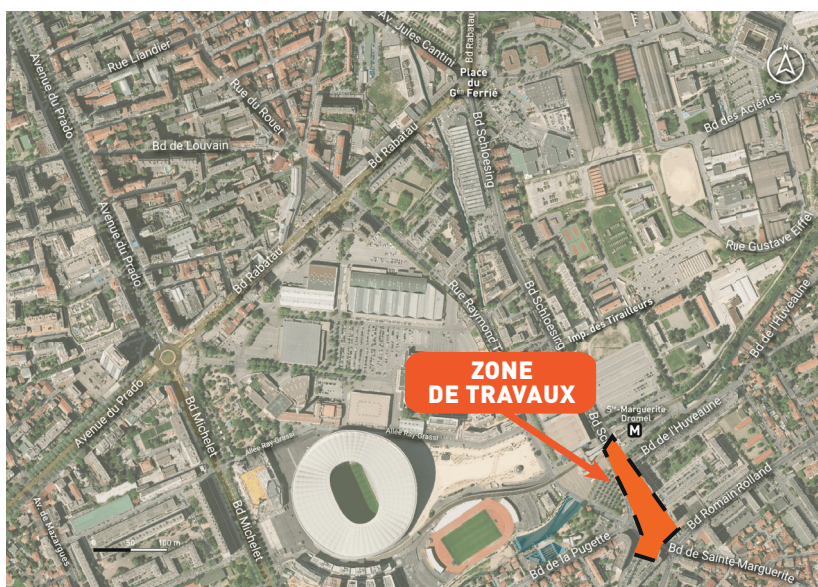
SCHÉMA DE REPÉRAGE

La 2 ème phase des travaux d'infrastructure du pont de l'Huveaune et d'aménagement urbain au niveau du carrefour Sainte-Marguerite Dromel débutera le 29 août 2023.