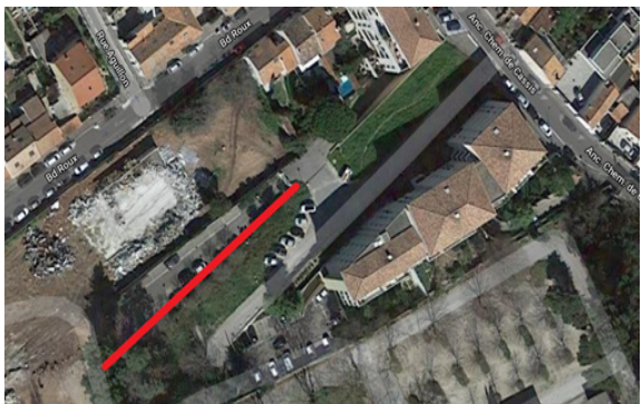
LOCALISATION DU MUR