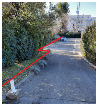
POSITION CLÔTURE HERAS